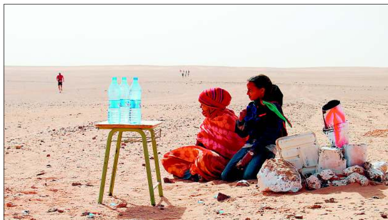
Unterwegs, mitten in der Wüste, warten Mädchen mit Trinkwasservorräten am Wegesrand.