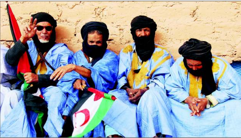
Vier ältere saharauische Männer sitzen in blauen Tuniken und mit schwarzen Turbanen bekleidet am Wegesrand und beobachten die Benefizläufe von dort aus.